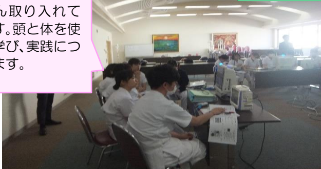
生体監視モニター研修